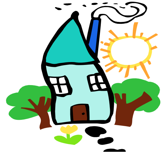
Programa de Sociedad e Inversion de Casas

HOUSING REHABILITATION TIENE- PRESTAMOS DIFERIDOS CON 0% INTERES A LOS DUEÑOS DE UNA CASA EN AREAS ESPECIFICAS EN EL CONDADO DE KANE.